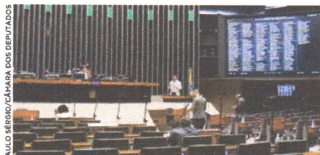
Projeto teve análise concluída nesta semana no Plenário Ulysses Guimarães, da Câmara Federal

deverão ter diretrizes para o uso da frota aerográfica. Para serem utilizadas nessas operações, as aeronaves deverão atender às normas técnicas definidas pelo poder público e ser pilotadas por profissionais qualificados para a atividade. De acordo ainda com a proposta, a política de emprego da aviação agrícola na atividade de combate a incêndio em todos os tipos de vegetação seria proposta pelo Ministério da Agricultura, Pecuária e